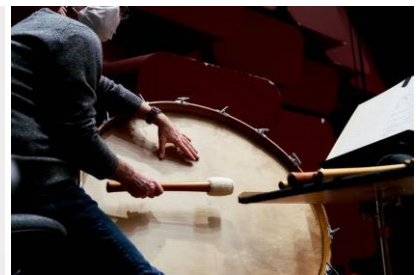
la grosse caisse