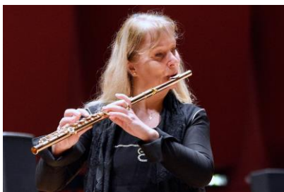
la flûte traversière