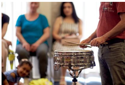
la caisse claire

Il existe beaucoup d'instruments dans la famille des percussions, par exemple :